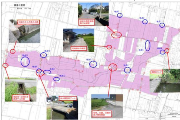
地区外受益への用水手当・宅地排水の調査状況